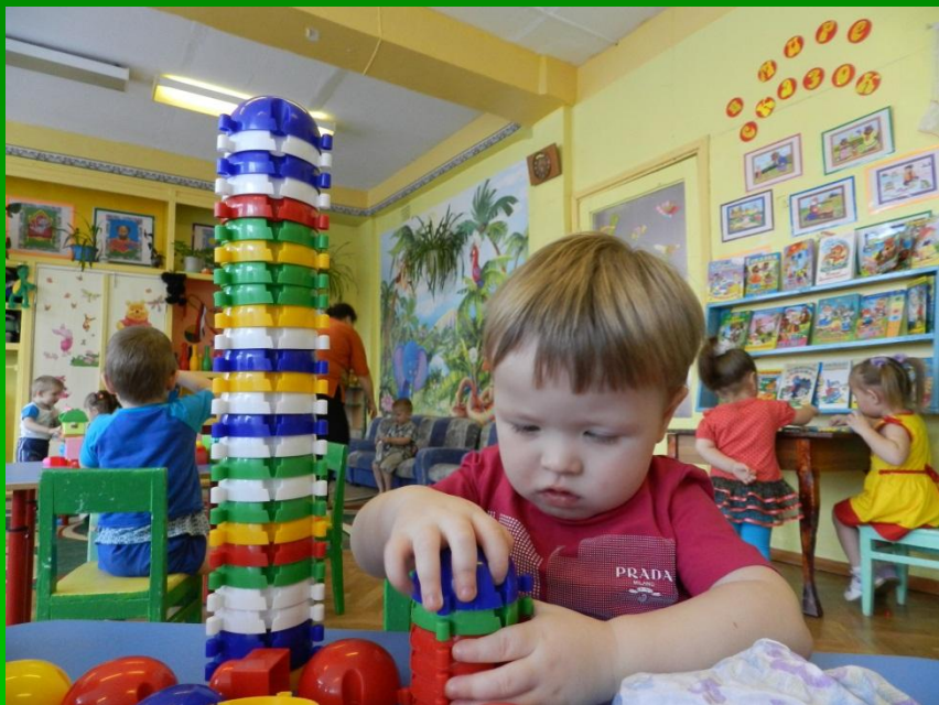
Игра «Раз ракушка, два ракушка»