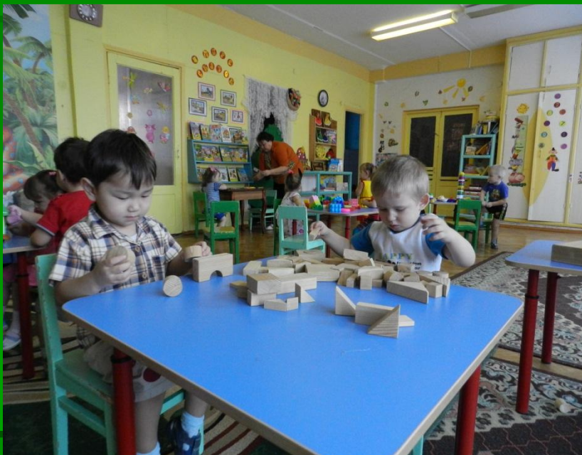
Игра «Строим дом»